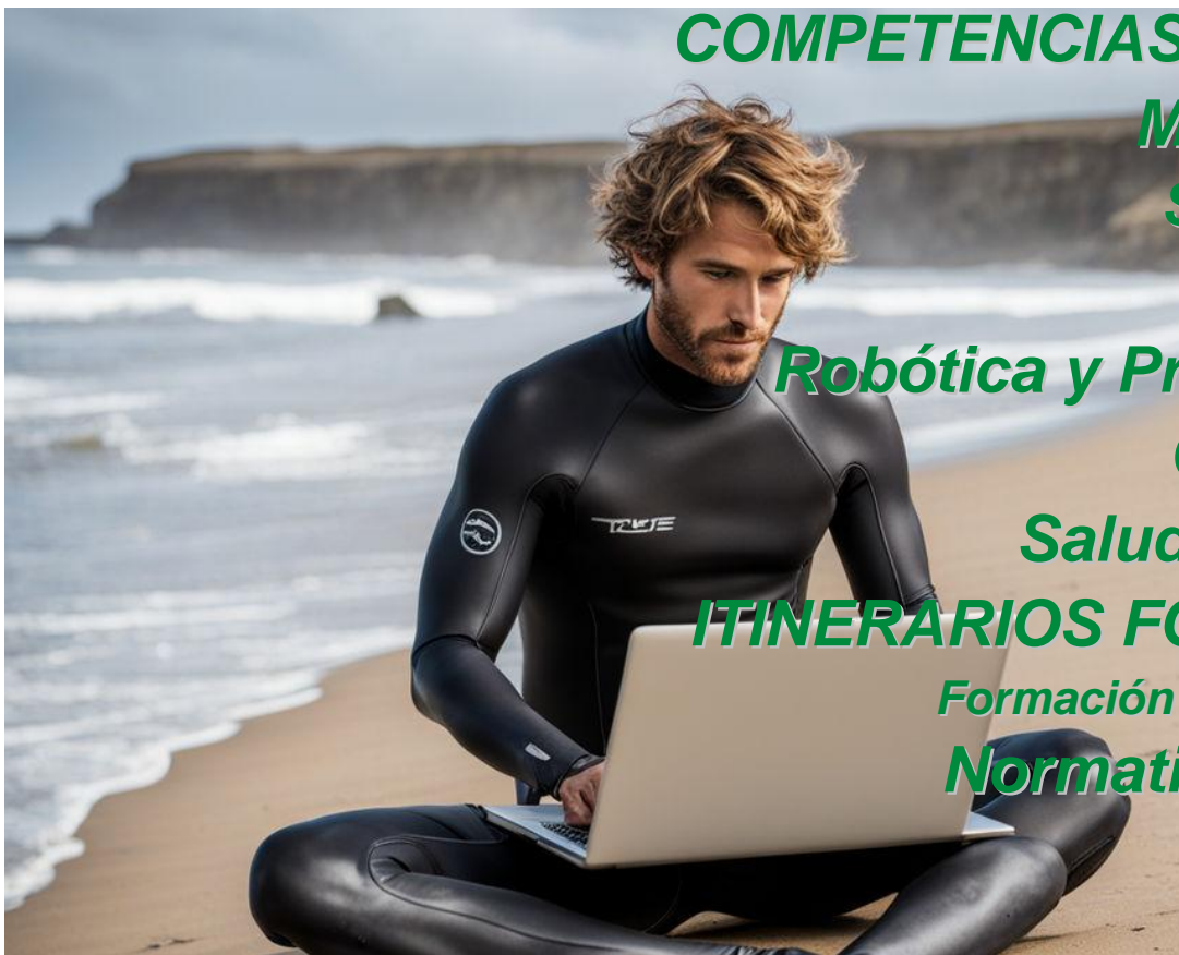
Imagen creada con inteligencia artificial